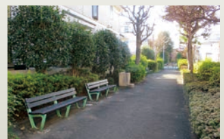
上井草二丁目付近