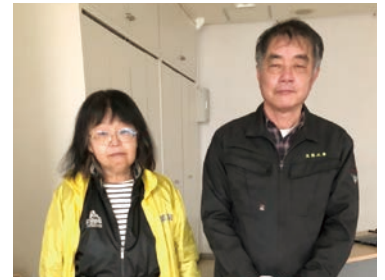
「天窓工房」のみなさん

その他、宇宙の年齢は約138億歳という事を教わったり、私たちの住んでいる銀河に1番近い銀河は「マゼラン銀河」(マゼラン星雲と呼ばれていた)という銀河であったり、ブラックホールのお話を聞いたり、最後は「地球」に戻り、30分の「宇宙旅行」は終了となりました。