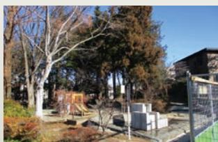
スタート地点 源流の切り通し公園