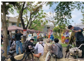
オープニング・フラダンス

「見て聴いて体験しよう～多世代交流イベント～東原春かぜまつり」が行われました。日頃ふらっと東原で自主事業をされている各団体の無料体験が行われ、お子さんから高齢の方までそれぞれの興味に応じて体験に参加されていました。模擬店もあり、爽やかなお天気にも恵まれて、皆さん楽しいひとときを過ごされていました。