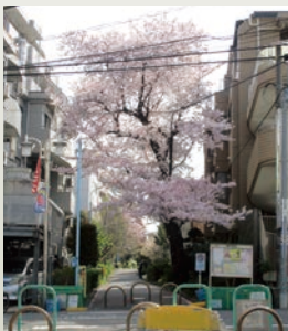
スタート地点・井荻駅付近

中瀬児童遊園の桜も見事です。早稲田通りと交差する中瀬橋辺りに神戸堰があり、その付近に井草の逆さ水と呼ばれた珍しい所がありました。通常、関東地方では川の水は西から東に流れていますがここだけは、東から西に向かって流れていたようです。中瀬橋から一直線に進むと昭和38年に開園したゴールの妙正寺公園です。