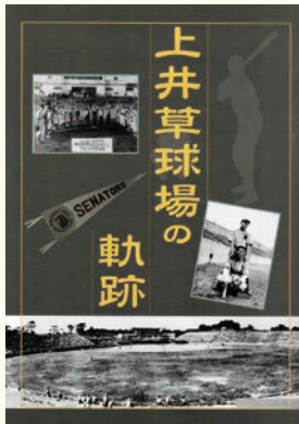
編集・発行:杉並区立郷土博物館