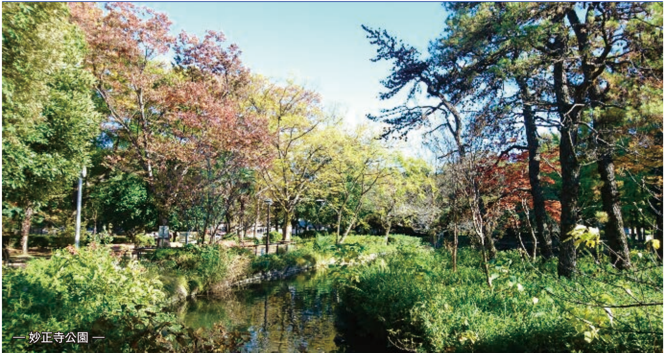
— 妙正寺公園 —