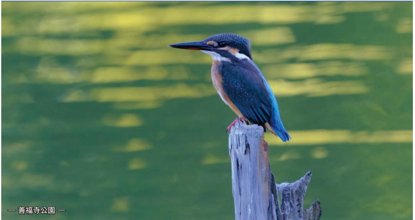
— 善福寺公園 —